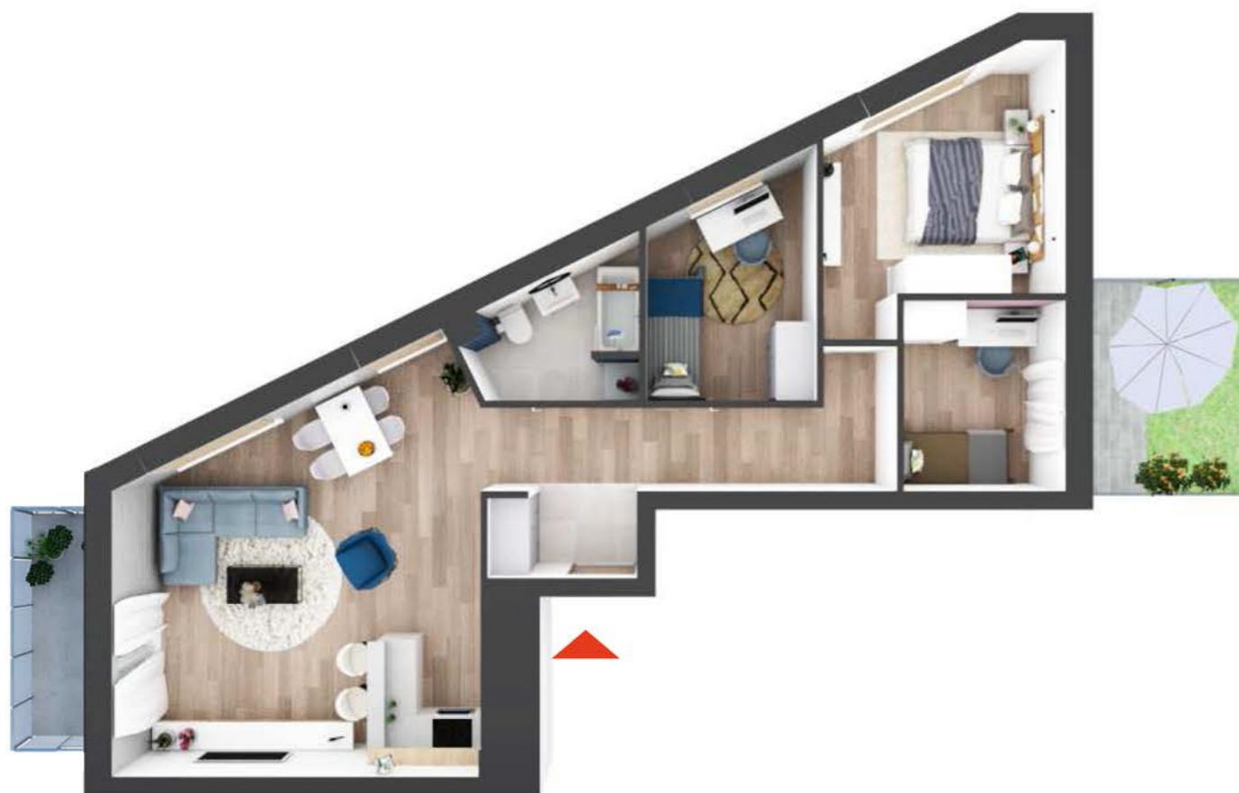
UWAGA: RZUT 3D MA CHARAKTER POGLĄDOWY I STANOWI JEDYNIĘ PRZYKŁADOWĄ ARANŻACJĘ MIESZKANIA