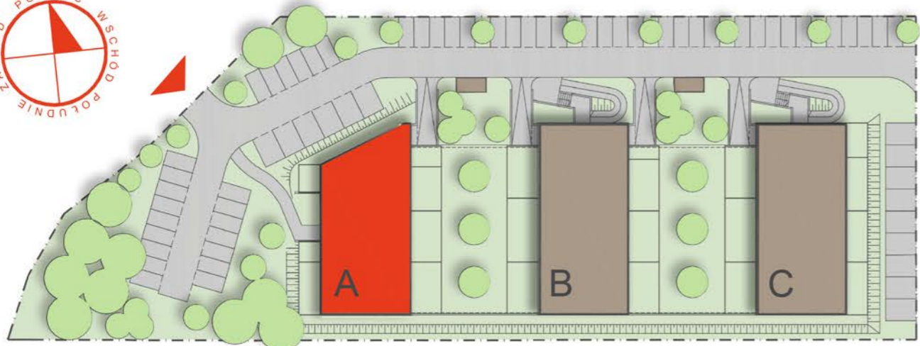
REJON UL. M. KONOPNICKIEJ W OSTROWIE WIELKOPOLSKIM