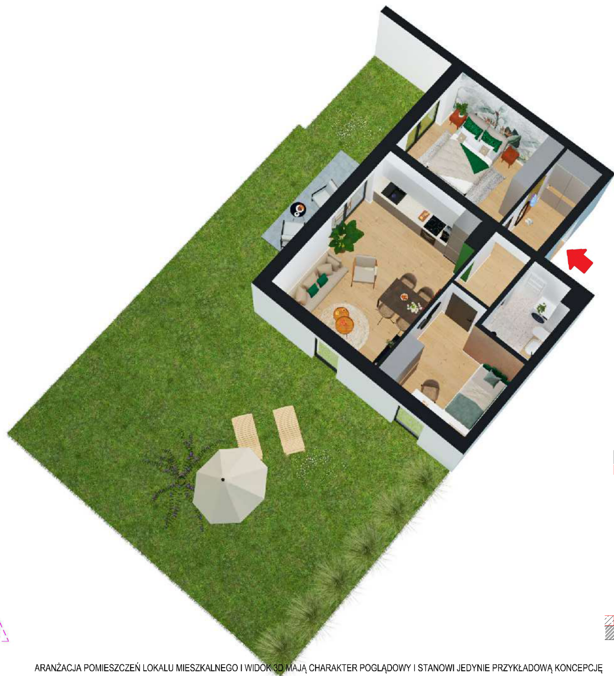
ARANŻACJA POMIESZCZEŃ LOKALU MIESZKALNEGO I WIDOK 3D MAJĄ CHARAKTER POGLĄDOWY I STANOWI JEDYNIĘ PRZYKŁADOWĄ KONCEPCJĘ

MIESZKANIE 3-POKOJOWE POW. UŻYTKOWA: 49,99 m 2 powierzchnia dodatkowa: ogródek 105 m 2