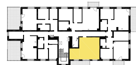
SCHEMAT LOKALIZACJI MIESZKANIA NA KONDYGNACJI