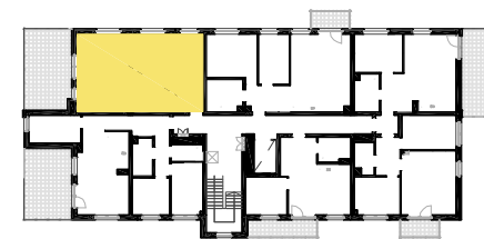
SCHEMAT LOKALIZACJI MIESZKANIA NA KONDYGNACJI