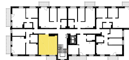
SCHEMAT LOKALIZACJI MIESZKANIA NA KONDYGNACJI