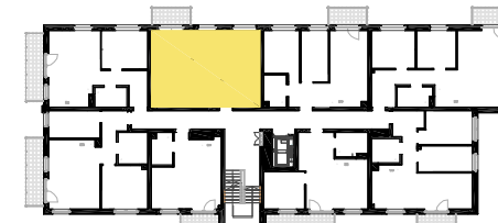
SCHEMAT LOKALIZACJI MIESZKANIA NA KONDYGNACJI