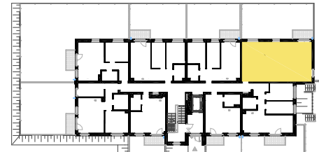
SCHEMAT LOKALIZACJI MIESZKANIA NA KONDYGNACJI