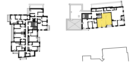
SCHEMAT LOKALIZACJI MIESZKANIA NA KONDYGNACJI