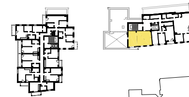
SCHEMAT LOKALIZACJI MIESZKANIA NA KONDYGNACJI