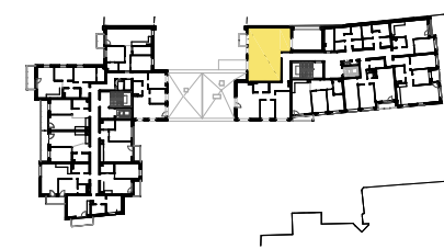
SCHEMAT LOKALIZACJI MIESZKANIA NA KONDYGNACJI