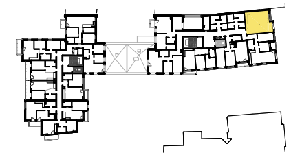
SCHEMAT LOKALIZACJI MIESZKANIA NA KONDYGNACJI