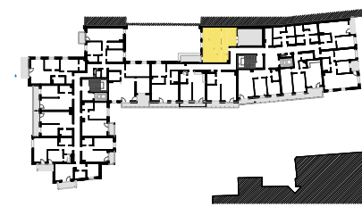
SCHEMAT LOKALIZACJI MIESZKANIA NA KONDYGNACJI