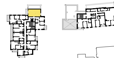
SCHEMAT LOKALIZACJI MIESZKANIA NA KONDYGNACJI