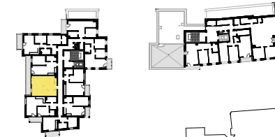
SCHEMAT LOKALIZACJI MIESZKANIA NA KONDYGNACJI