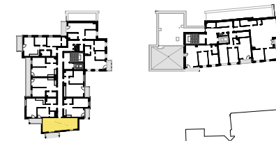
SCHEMAT LOKALIZACJI MIESZKANIA NA KONDYGNACJI