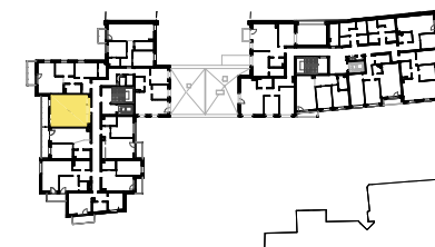
SCHEMAT LOKALIZACJI MIESZKANIA NA KONDYGNACJI