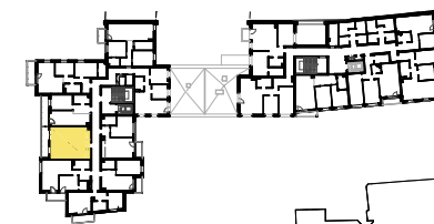
SCHEMAT LOKALIZACJI MIESZKANIA NA KONDYGNACJI