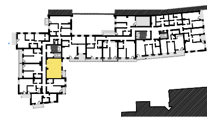
SCHEMAT LOKALIZACJI MIESZKANIA NA KONDYGNACJI