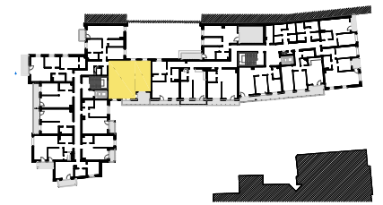
SCHEMAT LOKALIZACJI MIESZKANIA NA KONDYGNACJI