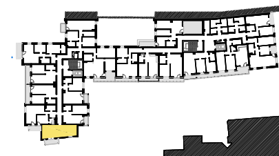
SCHEMAT LOKALIZACJI MIESZKANIA NA KONDYGNACJI