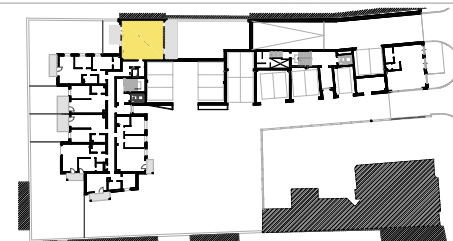
SCHEMAT LOKALIZACJI MIESZKANIA NA KONDYGNACJI